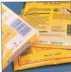
Folie · foil

Lebensmittelverpackungen, wie Plastikbeutel, Joghurtdeckel, Glasflaschen oder Milchkartons können zügig nach der Kennzeichnung weiterbehandelt werden, ohne das die Markierungen verwischen.